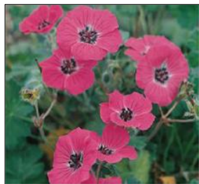
GERANIUM 2,5 ltrs.Decor

Familia Geraniaceae. Pleno sol, tolera sombrs parcial. Suelo bien drenado. Resistentes al frio. Floracion Verano. Buenos como tapizantes y en masas de for.