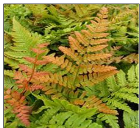
HELECHOS 2,5 ltrs.Decor